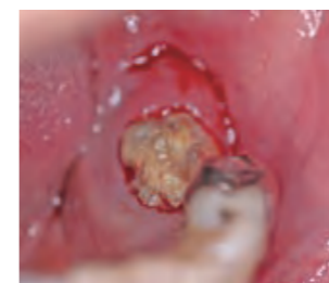
デノスマブによる顎骨壊死 腐骨が歯肉より出ているのが確認できる

最近増えているのが薬剤の副作用が原因で顎の骨が壊死してしまう疾患です。顎骨壊死を引き起こす薬剤は、骨粗しょう症や癌の骨転移に用いられるビスフォスフォネート系製剤やデノスマブが挙げられ、典型的な症状は、歯肉腫脹・疼痛・排膿・歯の動揺・長期にわたる顎骨の露出な