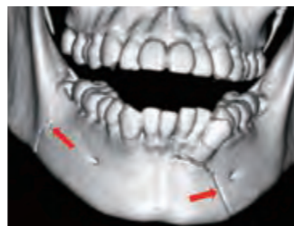
両側の下顎骨折 2ヶ所の骨折線を認め、3DCTが診断に有効

口腔顎顔面外傷は顔の皮膚や口腔粘膜などの損傷だけにとどまらず、歯の損傷や顔面を形成する骨の骨折を伴う場合が多くみられます。その結果、かみ合わせの機能まで損なうことがあります。口腔外科では外見の損傷の治療だけでなく、かみ合わせなどの機能の回復を重視した治療をおこないます。