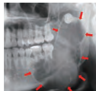
下顎のエナメル上皮腫 矢印が骨が溶けて、親知らずが上方に押し上げられている

口腔内の良性腫瘍には歯源性腫瘍と非歯源性腫瘍に大きく分かります。歯源性良性腫瘍の代表にエナメル上皮腫があります。原因は主として歯の芽(歯胚(しはい))の