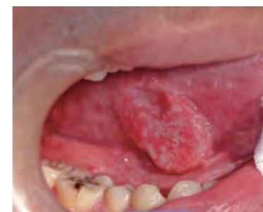
右側の舌下部に出来た舌癌

悪性腫瘍は、上皮性の癌腫(がんしゅ)と非上皮性の肉腫(にくしゅ)に分けられます。口腔領域ではほとん