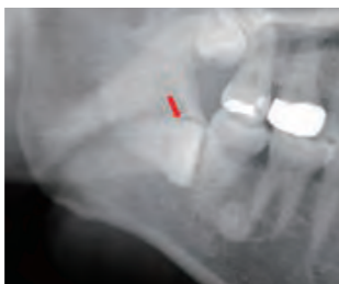
矢印は親知らずが横向きに埋まっている

当科で最も多い手術が親知らずの抜歯です。現代人は顎が小さくなり親知らずが並びきらず斜めや横向きの状態で大部分