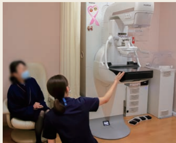
マンモグラフィ検査

ブレストセンターを設けることにより、多くの患者さんが検査を受けやすくなりました。検診を受けることに対するハードルが低くなったり、治療中の方であれば少しでも診療におけるストレスが少なくなることを願い、スタッフ一同よりいっそう日々の診療に尽くしてまいります。