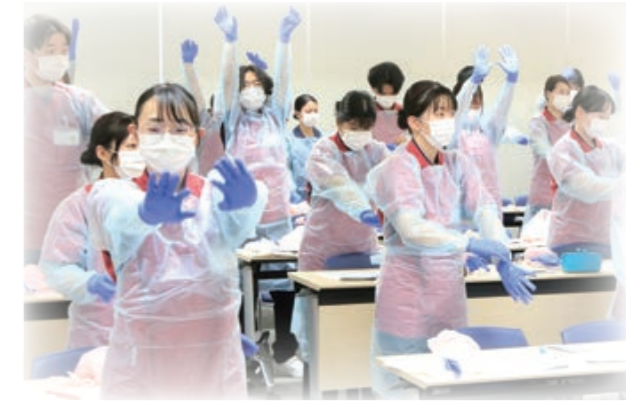
感染予防対策はしっかりと！