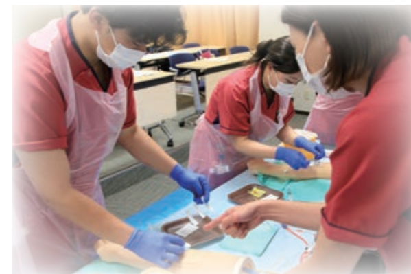
採血練習。まずは、模型から・・・