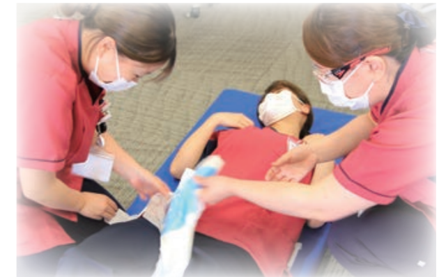
おむつ交換。意外とむずかしいなあ