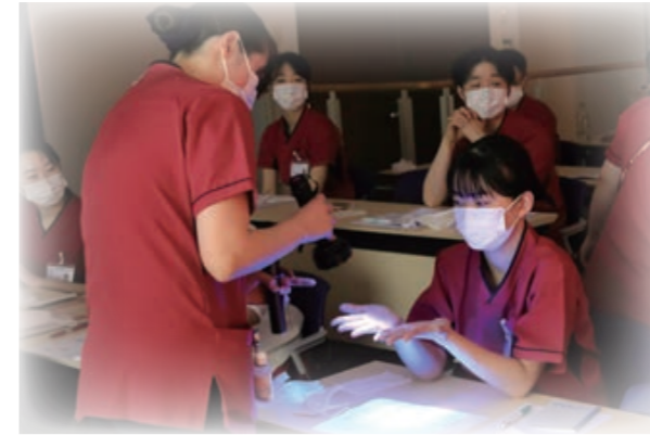
キレイに洗えてますね

今年も新入看護師を対象にさまざまな実技の集合教育を実施しました。採血などの日常的な手技や救命救急講習のほか、 安全の確認事項など、具体的な先輩の指導のもと真剣に取り組んでいます。