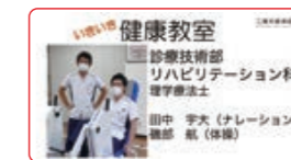
いきいき健康教室 (自宅でできるリハビリテーション)