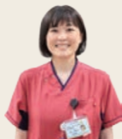
慢性心不全認定看護師

患者さんの全身状態や社会的な背景を評価し、より良い生活を送るためのトータル的なマネジメントをおこないます。