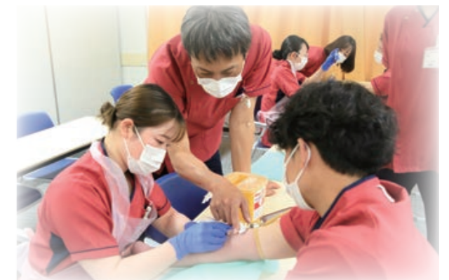
実践練習。しっかりやるぞ！