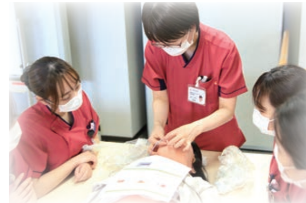
先輩がわかりやすく説明してくれます