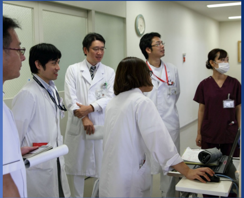
栄養サポートチーム