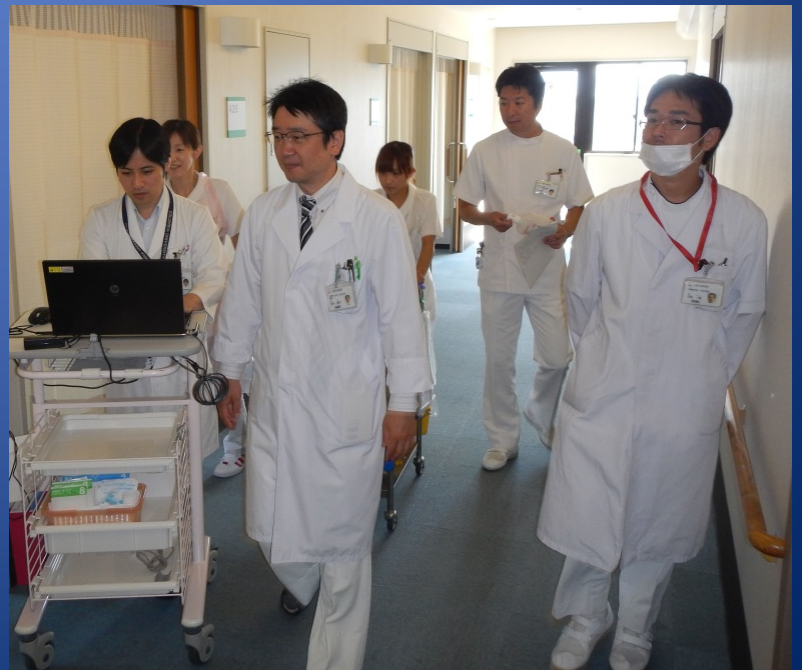
合同での病棟廻診